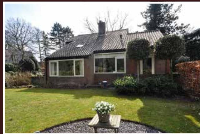
Verloren Eng, Blaricum