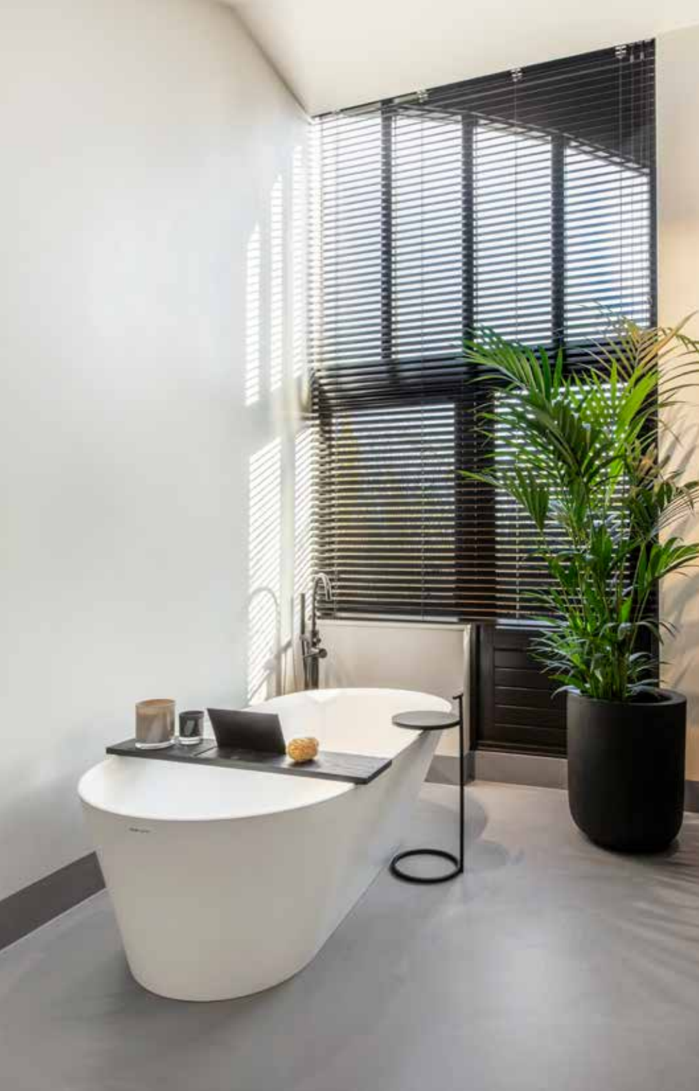
Bad Laufen by Kartell, kranen van Dornbracht, badmeubel Looox in samenwerking met Alape, douche- en toiletachterwanden van Silestone, douche- en toiletzijwanden van Daacha.